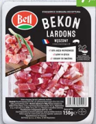
Bekon lardons BELL 2 x 60/150 g, wędzony