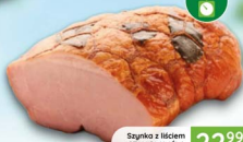
Szyńka z liściem STANISŁAWÓW 1,8 kg