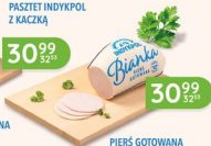
PIERŚ GOTOWANA BIANKA