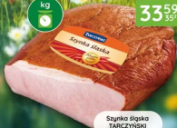
Szynka śląska TARCZYŃSKI 2 kg