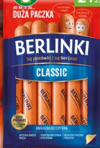
Parówki BERLINKI 700 g