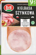
Kielbasa szynkowa BELL 250 g