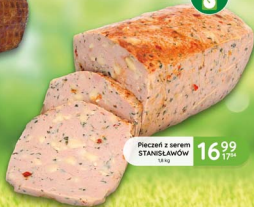
Pieczeń z serem STANISŁAWÓW 1,8 kg