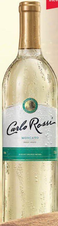
WINO CARLO ROSSI 0,75 l moscato B/S, pink moscato R/S, red sweet C/S