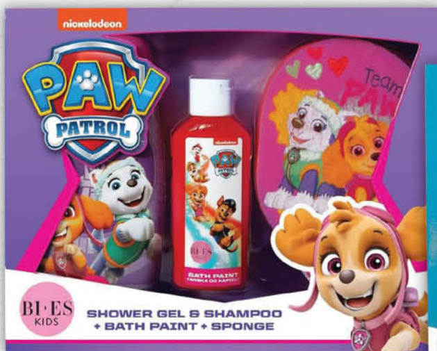
ZESTAW PAW PATROL boy: żel pod prysznic + gąbka + farbka girl: żel pod prysznic + gąbka + farbka