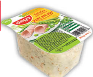
SALAŃKA MIĘSNA DEGA 250 g wszystkie rodzaje [śledzik po sułtańsku 180 g: 3,59/0 % VAT]