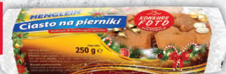
CIASTO NA PIERNIKI HENGLEIN 250 g