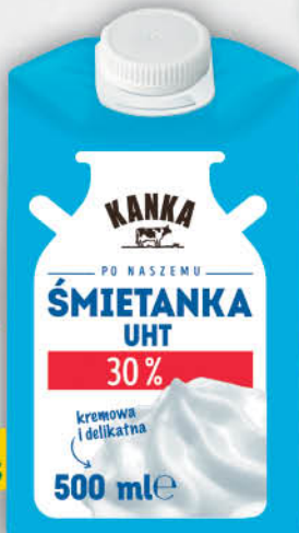
ŚMIETANA UHT KANKA 30 % 500 ml