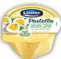
PASTELLA LISNER 80 g wszystkie rodzaje