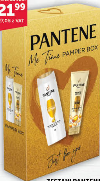
ZESTAW PANTENE szampon + odżywka