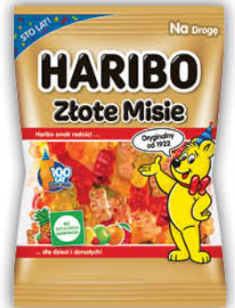
ŻELKI HARIBO 85 g wybrane rodzaje