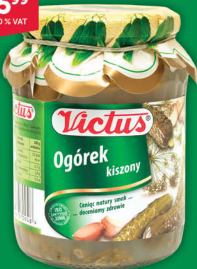
OGÓRKI KISZONE VICTUS 600 g