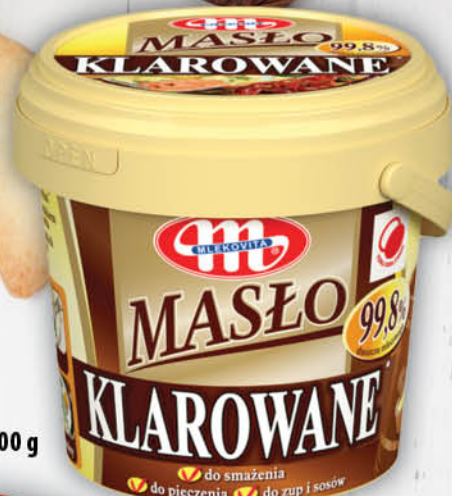
MASŁO KLAROWANE MLEKOVITA 500 g