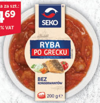
RYBA PO GRECKU SEKO 200 g