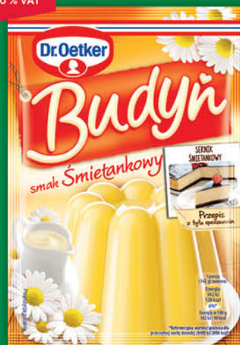
BUDYŃ DR. OETKER 40-45 g śmietankowy, waniliowy, czekoladowy