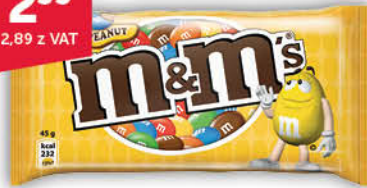
DRAŻE M&M'S 36-45 g wybrane rodzaje