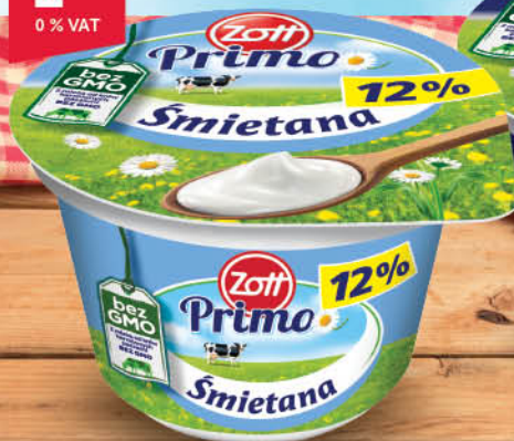
ŚMIETANA PRIMO 12 % 180 g