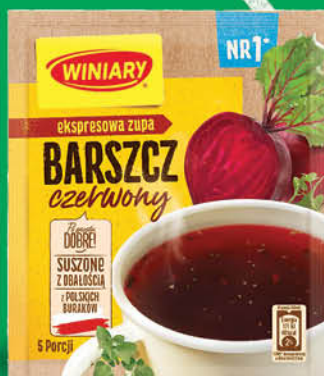
ZUPA WINIARY 40-75 g wszystkie rodzaje