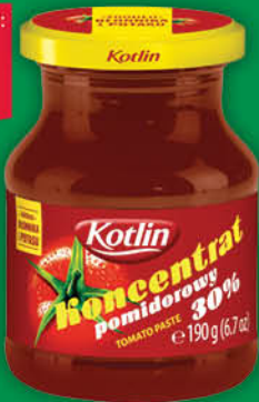
KONCENTRAT POMIDOROWY KOTLIN 190 g