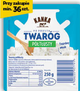
TWARÓG PÓŁTŁUSTY KANKA 250 g