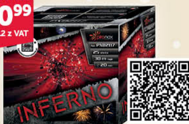
BATERIA 25 STRZAŁOWA PXB2117 INFERNO