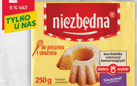
TŁUSZCZ ROŚLINNY 70 % NIEZBĘDNA 250 g