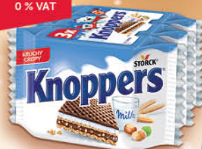
WAFLE KNOPPERS 3 x 25 g