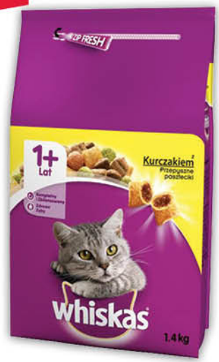
KARMA DLA KOTA Z KURCZAKIEM WHISKAS 1,4 kg