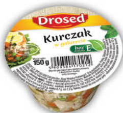
MIĘSO W GALARECIE DROSED 150 g kurczak, wieprzowina