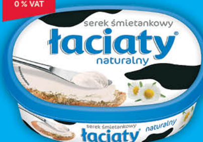
SEREK ŚMIETANKOWY ŁACIĄTY 135 g wszystkie rodzaje