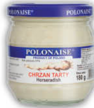
CHRZAN TARTY EXTRA POLONAISE 180 g