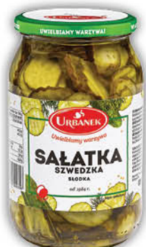
SAŁATKA SZWEDZKA URBANEK 410 g