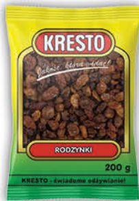
RODZYNKI KRESTO 200 g [100 g: 1,99/0% VAT]