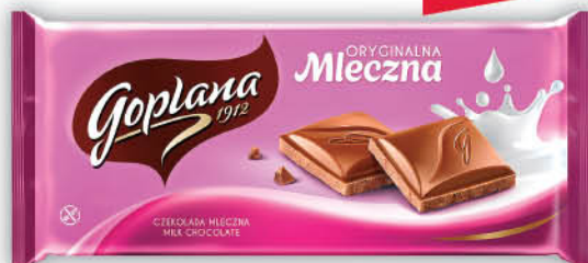
CZEKOLADA GOPLANA 90 g wybrane rodzaje