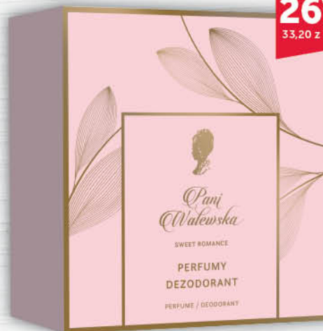
ZESTAW PANI WALEWSKA dezodorant + perfumy