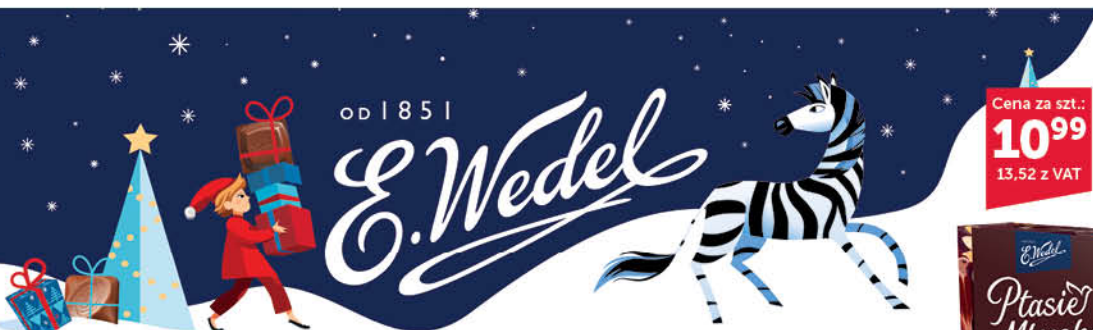
CZEKOLADA WEDEL 80-100 g wszystkie rodzaje