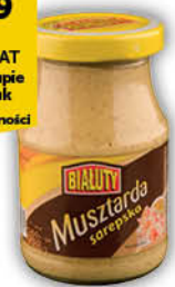
MUSZTARDA BIAŁUTY SAREPSKA 190 g

Cena za szt.: 2 19 2,37 z VAT Przy zakupie 20 sztuk i wielokrotności