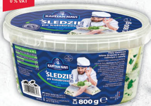
ŚLEDZIE PO KOŁOBRZESKU KAPITAN NAVI 800 g [filet śledziowe rolmops/bismarck 400 g: 7,99/0 % VAT]