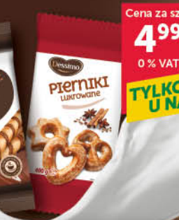
PIERNIKI DESSIMO 400 g wszystkie rodzaje