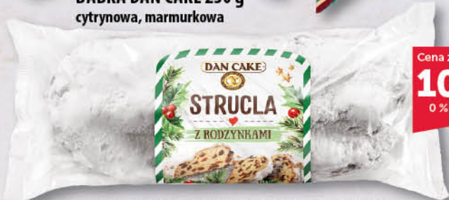
STRUCLA DROŻDŻOWA Z RODZYNKAMI DAN CAKE 500 g