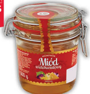
MIÓD WIELOKWIATOWY KRÓLOWA PSZCZOŁ 500 g