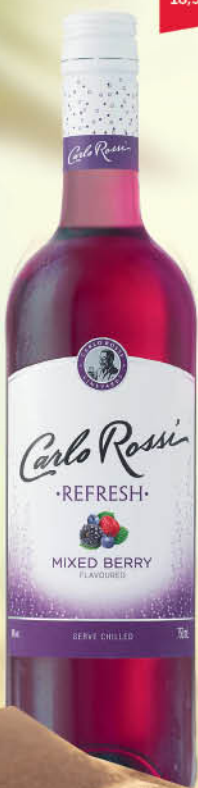
WINO CARLO ROSSI REFRESH 0,75 l wszystkie rodzaje