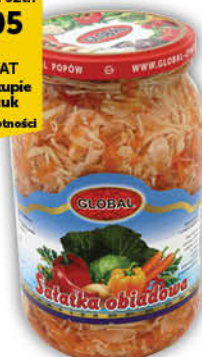
SAŁATKA OBIADOWA GLOBAL 900 ml

Cena za szt.: 4 05 0 % VAT Przy zakupie 10 sztuk i wielokrotności