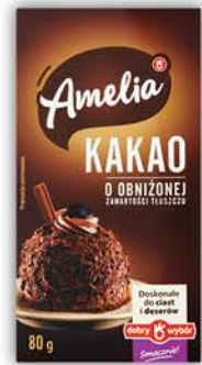
KAKAO AMELIA 80 g