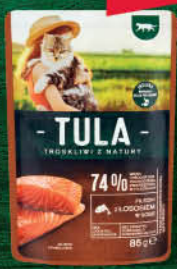
KARMA DLA KOTA SASZETKA 85 g wszystkie rodzaje