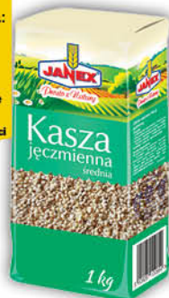
KASZA JĘCZMIENNA WIEJSKA JANEX 1 kg średnia, gruba