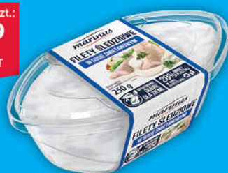
FILET ŚLEDZIOWE W SOSIE MARINUS 250 g śmietanowym, koperkowym, musztardowym