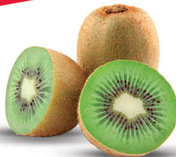
KIWI KL.1 LUZ