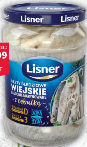
FILETY ŚLEDZIOWE LISNER WIEJSKIE 600 g [a'la matias 220/175 g: 6,99/0 % VAT]