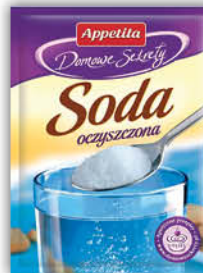
SODA OCZYSZCZONA APPETITA 30 g [amoniak 30 g: 1,19/1,46]