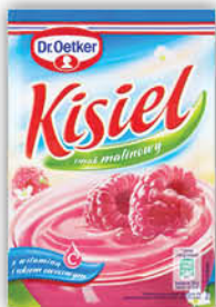
KISIEL DR. OETKER 38 g malinowy, cytrynowy, żurawinowy