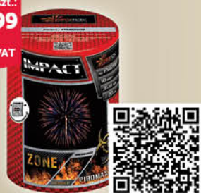
BATERIA 10 STRZAŁOWA PXB2110 IMPACT

Potwierdzamy, że zgodnie z polskim prawem używanie produktów pirotechnicznych jest DOZWOLONE NA TERENACH PRYWATNYCH PRZEZ CAŁY ROK więcej na www.fundacjapozytywnemocje.pl