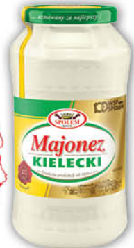
MAJONEZ KIELECKI 700 ml