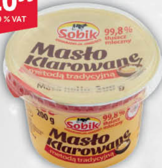
MASŁO KLAROWANE SOBİK 200 g