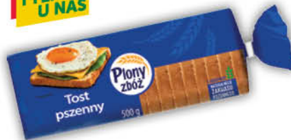
TOST PSZENNY PLONY ZBÓŻ 500 g