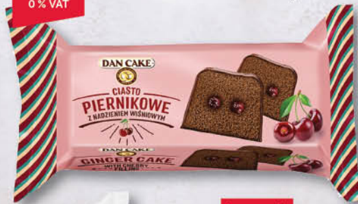
CIASTO PIERNIKOWE Z NADZIEMIEM WIŚNIOWYM DAN CAKE 400 g