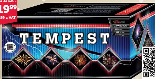
BATERIA 48 STRZAŁOWA PXB2429 TEMPEST