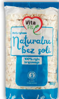
WAFLE RYZOWE VITAFIT 100 g wszystkie rodzaje