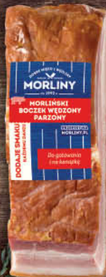
BOCZEK WĘDZONY PARZONY MORLINY ok. 450 g [boczek wędzony, parzony morliny ok. 2 kg: 22,90/0 % VAT]