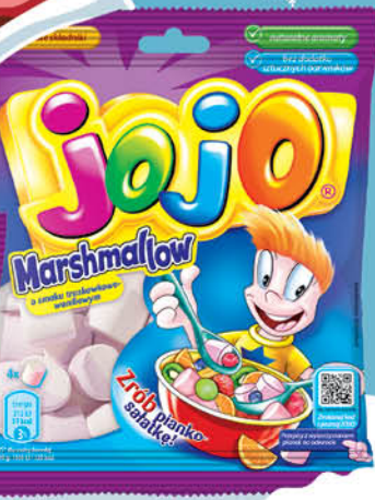
PIANKI JOJO 86-90 g marshmallow, zakrecone