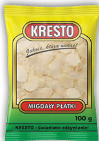
MIGDAŁY PŁATKI KRESTO 100 g