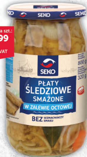
PŁATY ŚLEDZIOWE SMAŻONE W ZALEWIE OCTOWEJ SEKO 800 g [filet z makreli w zalewie octowej 800 g: 13,99/0 % VAT]