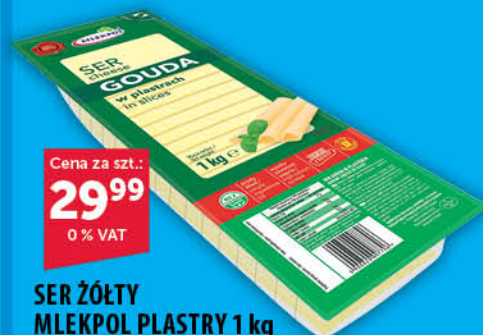
SER ŻÓŁTY MLEKPOL PLASTRY 1 kg gouda, edamski [złoty Mazur 1 kg: 31,99/0 % VAT; królewski z Kolna: 32,99/0 % VAT; sałami 800 g: 24,99/0 % VAT]