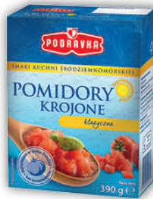
POMIDORY PODRAVKA 390 g wszystkie rodzaje