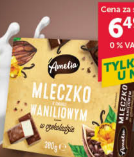
MLECZKO AMELIA 380 g wszystkie rodzaje [malinowe 420 g; 6,49/0% VAT]