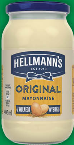
MAJONEZ HELLMANN'S 405 ml oryginalny, babuni