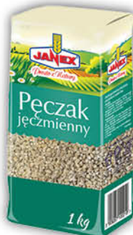
KASZA JĘCZMIENNA PĘCZAK JANEX 1 kg