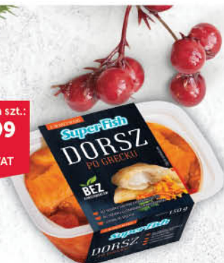
DORSZ PO GRECKU SUPERFISH 150 g [łosoś koral plasterki 100 g: 12,99/0 % VAT]