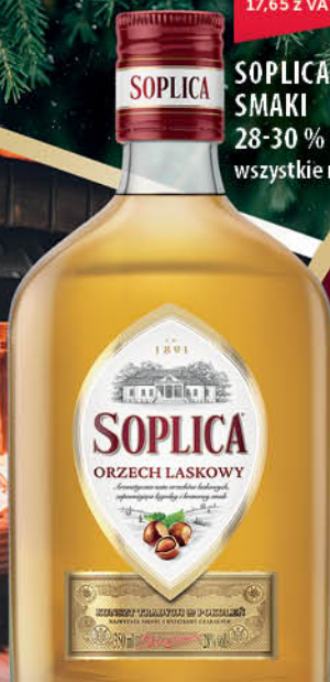
SOPLICA SMAKI 28-30 % 0,35 l wszystkie rodzaje