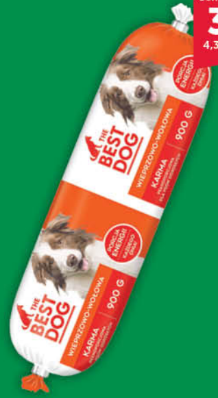
KARMA DLA PSA WIEPRZOWO-WOŁOWA THE BEST DOG 900 g