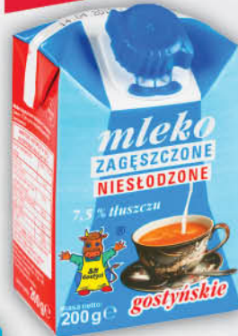
MLEKO ZAGĘSZCZONE NIESŁODZONE GOSTYŃ 200 g