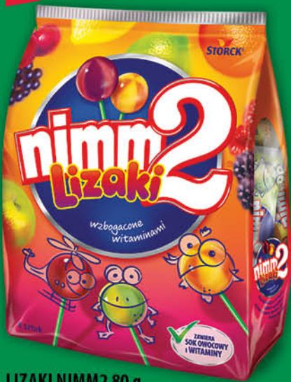
LIZAKI NIMM2 80 g