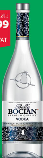
WÓDKA BIAŁY BOCIAN 40 % 0,7 l