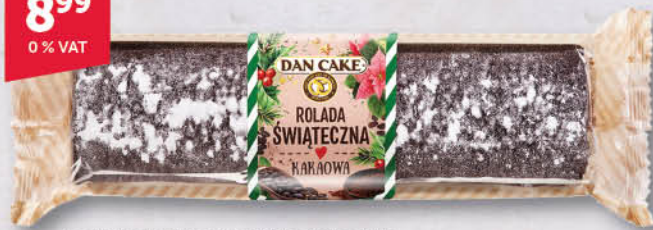
ROLADA ŚWIĄTECZNA DAN CAKE 370 g