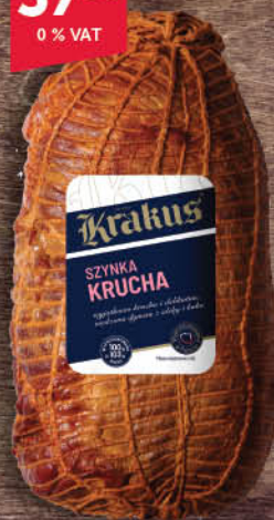
SZYNKA KRUCHA KRAKUS ok. 2 kg luz szynka krucha mała 1/2 ok.0,5 kg