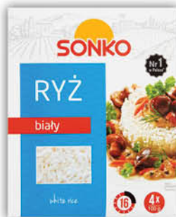
RYŻ BIAŁY SONKO 4 x 100 g [1 kg: 6,39/0 % VAT; ryż Albaris 4 x 100 g: 3,49/0 % VAT]