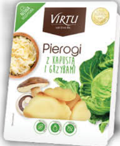
PIEROGI VIRTU 400 g z kapustą i grzybami, ruskie