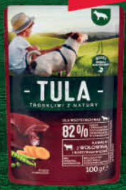
KARMA DLA PSA SASZETKA 100 g wszystkie rodzaje