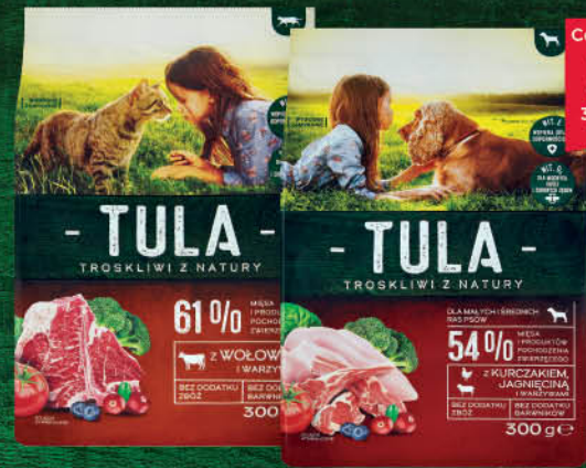
KARMA SUCHA DLA PSA, KOTA 300 g wszystkie rodzaje