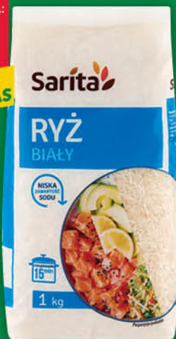
RYŻ BIAŁY SARITA 1 kg