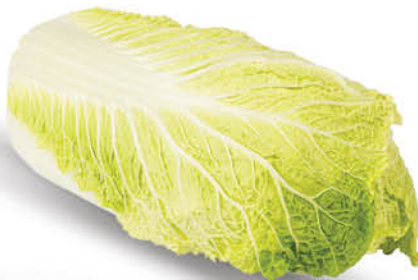
KAPUSTA PEKIŃSKA 1 szt.