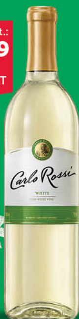
WINO CARLO ROSSI 0,75 l B/PW, C/PW, R/PW, Dark C/PW