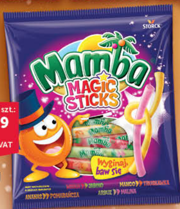
GUMA MAMBA 140 g wszystkie rodzaje