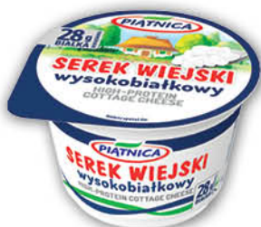
SEREK WIEJSKI PIATNICA 200 g wysokobiałkowy, bez laktozy