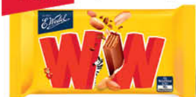
BATON WW WEDEL 47 g wybrane rodzaje