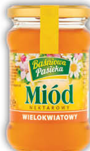
MIÓD WIELOKWIATOWY BAŚNIOWA PASIEKA 370 g