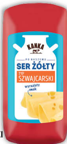
SER ŻÓŁTY TYP SZWAJCARSKI KANKA