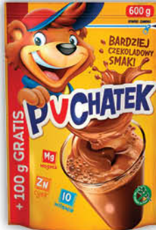
NAPÓJ KAKAOWY PUCHATEK 500 g + 100 g GRATIS