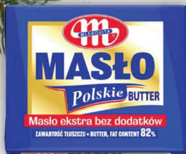
MASŁO EXTRA POLSKIE MLEKOVITA 200 g