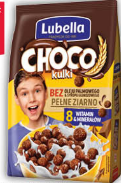
PLĄTKI MLEKOŁAKI 250 g wszystkie rodzaje