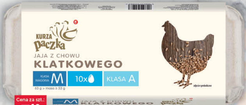
JAJA Z CHOWU KLATKOWEGO KL. M KURZA PACZKA 10 szt. [z wolnego wybiegu kl L 10 szt.: 9,49/0 % VAT]