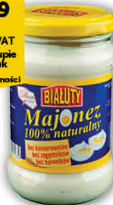
MAJONEZ BEZ KONSERWANTÓW BIAŁUTY 390 g

Cena za szt.: 7 49 8,09 z VAT Przy zakupie 16 sztuk i wielokrotności