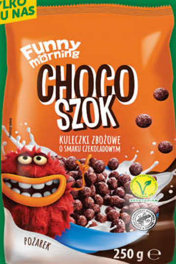
KULECZKI ZBOŻOWE CHOCOSZOK 250 g wszystkie rodzaje