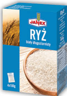
RYŻ BIAŁY JANEX 4 x 100 g