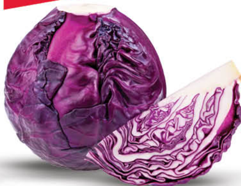
KAPUSTA CZERWONA LUZ