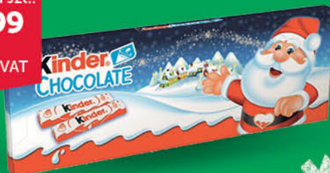
CZEKOLADKI KINDER CHOCOLATE 150 g