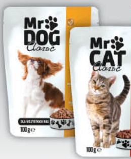
KARMA DLA KOTA MR CAT, DLA PSA MR DOG SASZETKA 100 g wszystkie rodzaje