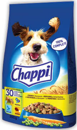
KARMA DLA PSA CHAPPI 500 g wszystkie rodzaje