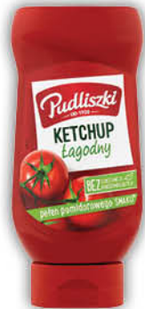
KETCHUP PUDLISZKI 480 g łagodny, pikantny