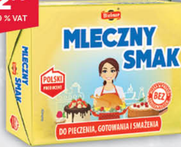
MARGARYNA MLECZNY SMAK BIELMAR 250 g