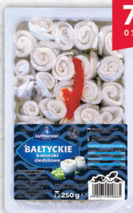
KORECZKI BAŁTYCKIE KAPITAN NAVI 250 g [śledź po kołobrzescu z suszonymi pomidorami 300 g: 6,99/0 % VAT]