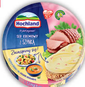
SER TOPIONY HOCHLAND KRĄŻEK 180 g wybrane rodzaje