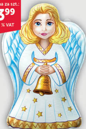
FIGURKA ANIOŁEK FIGARO 60 g