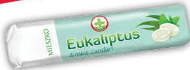
CUKIERKI Z EUKALIPTUSEM MIESZKO 32 g