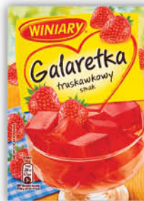
GALARETKA WINIARY 39-75 g wybrane rodzaje