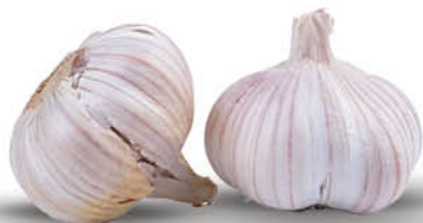
CZOSNEK 1 szt.