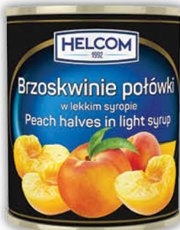
BRZOSKWINIE POŁÓWKI W SYROPIE HELCOM 850 ml