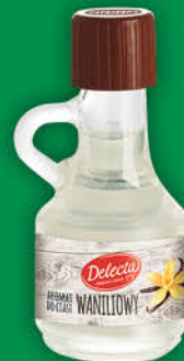
AROMAT DO CIAST DELECTA 9 ml waniliowy, migdałowy, pomarańczowy [naturalny waniliowy 30 ml: 4,79/5,89]