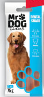
DENTAL SNACK DLA PSA MR DOG 75 g