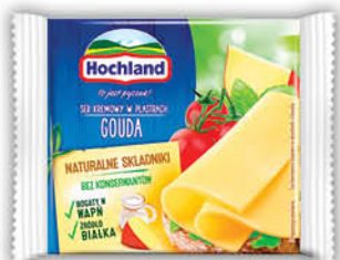
SER TOPIONY HOCHLAND 130 g wszystkie rodzaje