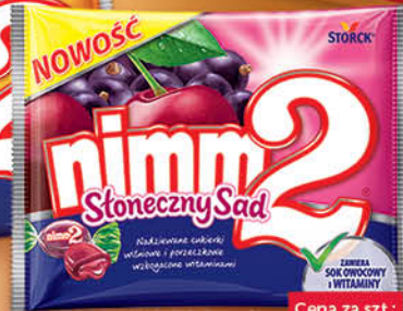
CUKIERKI NIMM2 90 g z witaminami, słoneczny sad