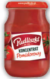
KONCENTRAT POMIDOROWY PUDLISZKI 30% 195 g