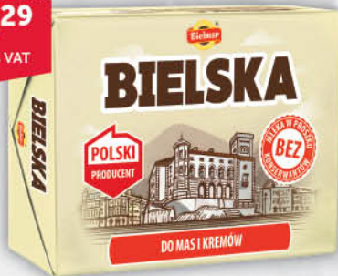
MARGARYNA BIELSKA BIELMAR 250 g