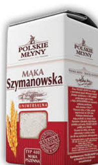
MAKA PSZENNA TYP 480 SZYMANOWSKA 1 kg krupczatka szymanów, tortowa szymanów 1 kg