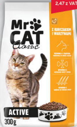
KARMA SUCHA DLA KOTA MR CAT 300 g wszystkie rodzaje