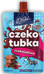
CZEKO TUBKA WEDEL 50 g wszystkie rodzaje