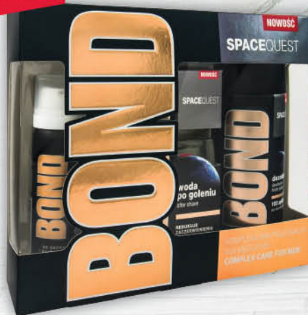
ZESTAW BOND SPACEQUEST dezodorant + pianka do golenia + woda po goleniu