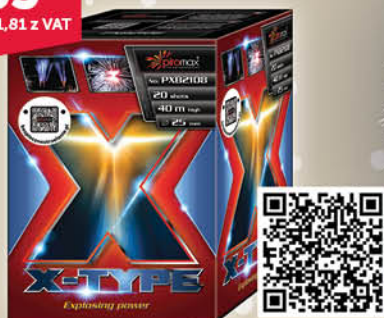
BATERIA 20 STRZAŁOWA PXB2108 X-TYPE