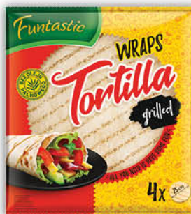
TORTILLA DEVELEY 250-296 g wszystkie rodzaje [sos tabasco czerwony 60 ml: rabat 20 % przy zakupie 6 szt. i wielokrotności]

Przy zakupie min. 6 sztuk i wielokrot. 15% RABATU