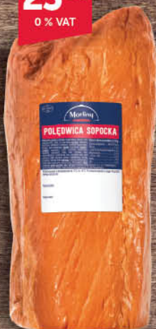
POŁĘDWICA SOPÓCKA MORLINY LUZ ok. 0,5 kg/ok.2 kg