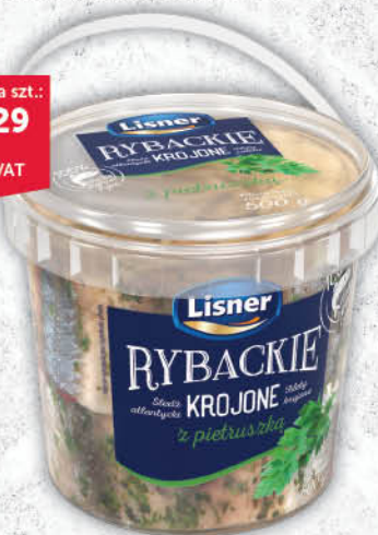
FILETY ŚLEDZIOWE RYBACKIE Z PIETRUSZKĄ LISNER 500 g