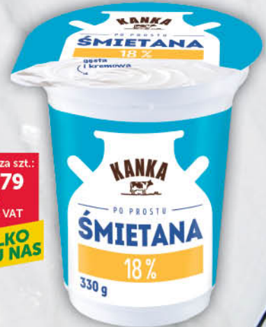
ŚMIETANA KANKA 18 % 330 g [12%: 2,79/0 % VAT]