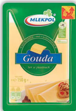
SER MLEKPOL PLASTRY 150 g wszystkie rodzaje