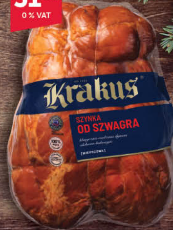
SZYNKA OD SZWAGRA KRAKUS [schab od szwagra luz 1 kg: 34,90/0 % VAT]