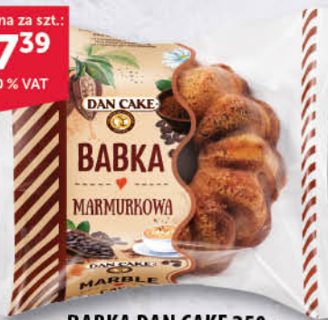
BABKA DAN CAKE 250 g cytrynowa, marmurkowa