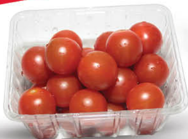
POMIDOR CHERRY KL.1 250 g