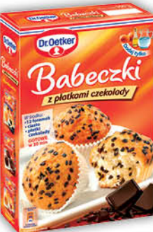
CIASTKA BABECZKI Z PŁATKAMI CZEKOLADY DR. OETKER 300 g