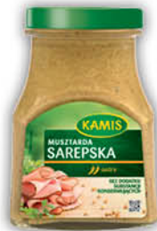
MUSZTARDA KAMIS 180-185 g sarepska, delikatesowa, chrzanowa, czeska [180-185 g: francuska: 2,99/3,23, rosyjska: 2,79/3,01]