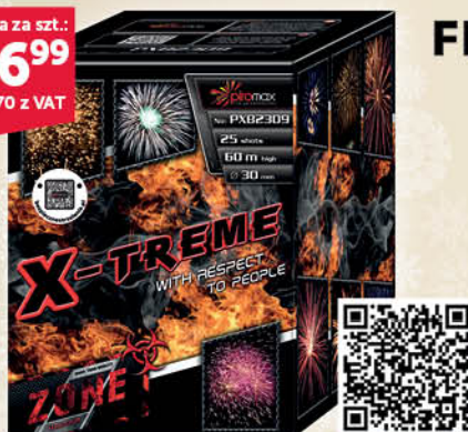
BATERIA 25 STRZAŁOWA PXB2309 X-TREME