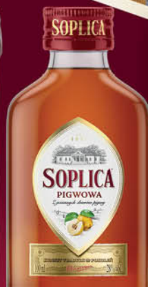
SOPLICA SMAKI 28-30 % 0,1 l wszystkie rodzaje