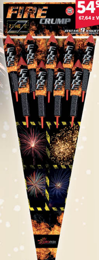
ZESTAW 9 RAKIET PXR209 FIRE CRUMP