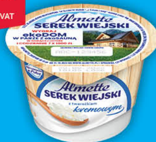
SEREK ALMETTE WIEJSKI HOCHLAND 150 g wszystkie rodzaje