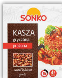
KASZA GRYCZANA PRAŻONA SONKO 4 x 100 g [jęczmienna: wiejska: 2,89/0 % VAT, perłowa: 3,19/0 % VAT]

Przy zakupie min. 6 sztuk i wielokrot. 15% RABATU