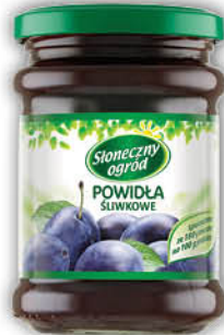
POWIDŁA ŚLIWKOWE SŁONECZNY OGRÓD 290 g