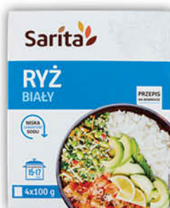
RYŻ BIAŁY SARITA 4 x 100 g [4 x 100 g: brązowy: 2,45/0 % VAT, parboiled: 2,55/0 % VAT]