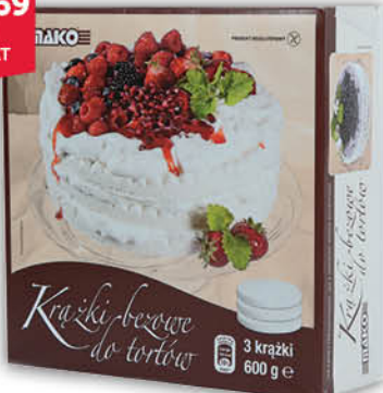
KRĄŻKI BEZOWE MAKO DO TORTÓW 600 g