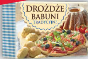
DROŹDZE BABUNI LESAFFRE 100 g