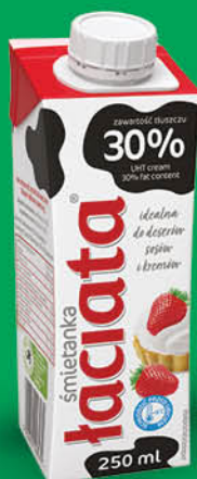
ŚMIETANKA UHT ŁACIATA 30 % 0,25 l