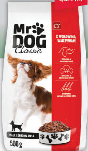
KARMA SUCHA DLA PSA MR DOG 500 g wszystkie rodzaje