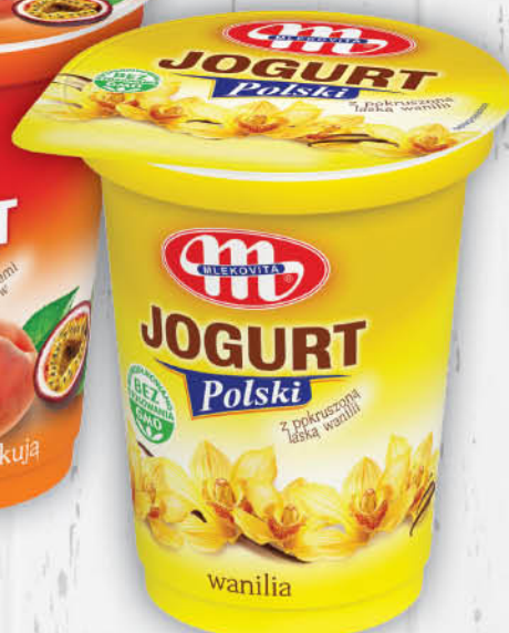
JOGURT POLSKI MLEKOVITA 350 g wszystkie rodzaje