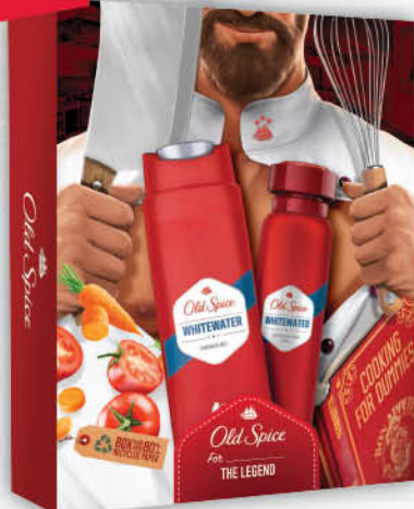
ZESTAW OLD SPICE NEWCHEF dezodorant + żel pod prysznic