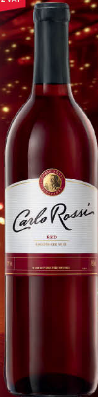
WINO CARLO ROSSI 0,75 l C/PW, B/PW, R/PW [Dark C/PW: 15,99/ 19,67]

Informacja Handlowa - Informacja używana o celów handlowych pomiędzy przedsiębiorcami zajmującymi się produkcją, obrotem hurtowym handlem napojami alkoholowymi