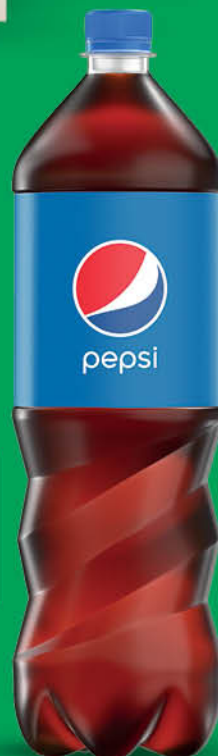
NAPÓJ GAZOWANY PEPSI 1,5 l wszystkie rodzaje

Informacja Handlowa - Informacja używana do celów handlowych pomiędzy przedsiębiorcami zajmującymi się produkcją, obrotem hurtowym i handlem napojami alkoholowymi