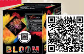
BATERIA 9 STRZAŁOWA PXB2010P BLOOM