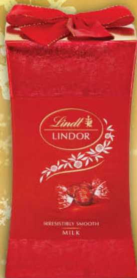
CZEKOLADKI LINDT MILK MINI PILLAR 75 g