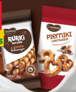
RURKI Z KREMEM DESSIMO 150 g wszystkie rodzaje