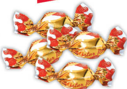
CUKIERKI MISTER RON SOLIDARNOŚĆ 1 kg