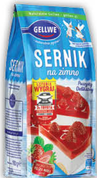
CIASTO SERNIK NA ZIMNO GELLWE 193 g klasyczny, borówkowy