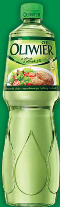
OLEJ OLIWIER 1 l