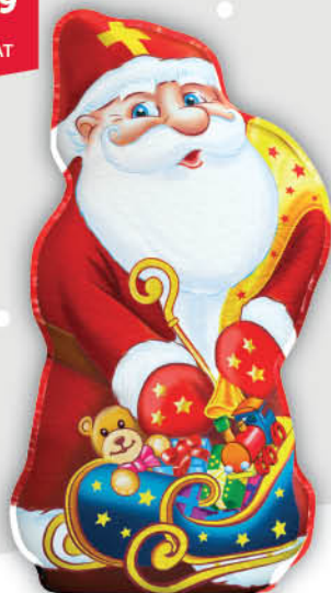
FIGURKA MIKOŁAJ FIGARO 110 g