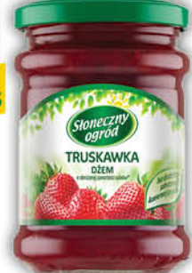
DŻEM SŁONECZNY OGRÓD 280 g wszystkie rodzaje