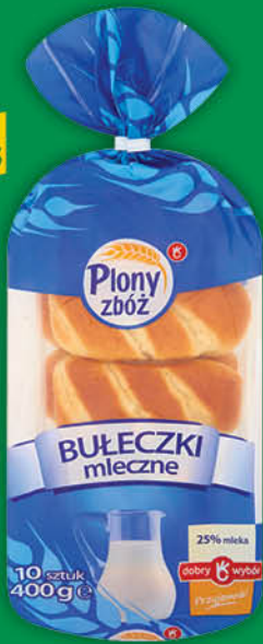
BUŁECZKI MLECZNE PLONY ZBÓŻ 400 g