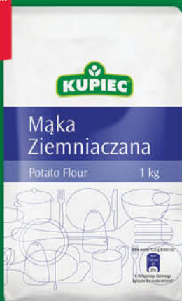
MAKA ZIEMNIACZANA KUPIEC 1 kg