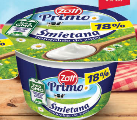
ŚMIETANA PRIMO 18 % 180 g