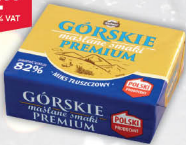
MIKS TŁUSZCZY GÓRSKIE PREMIUM 82 % 200 g