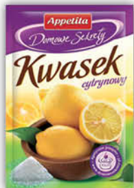
KWASEK CYTRYNOWY APPETITA 20 g [cukier wanilinowy 15 g: 0,55/0,59, proszek do pieczenia 15 g: 0,45/0,55]