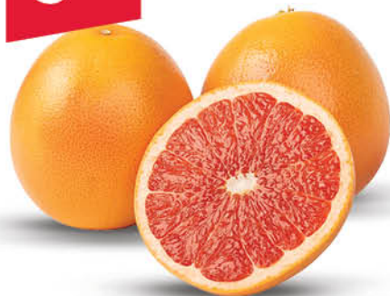
GREJPFRUT CZERWONY LUZ