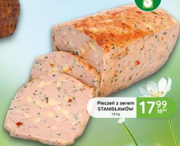
Pieczeń z serem STANISŁAWÓW 1,8 kg