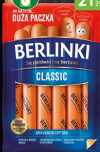
Parówki BERLINKI 700 g