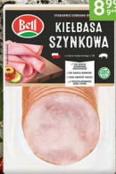
Kielbasa szynkowa BELL 250 g