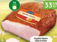
Szyńka śląska TARCZYŃSKI 2 kg