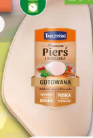
Pierś gotowana z kurczaka TARCZYŃSKI 2.9 kg