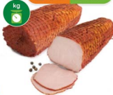
Pałędwicz z pieca