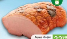
Szynka z liściem STANISŁAWÓW 1,6 kg