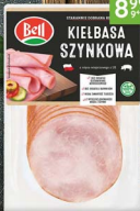
Kielbasa szynkowa BELL 250 g