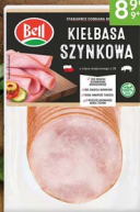
Kielbasa szynkowa BELL 250 g