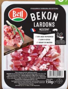
Bekon lardons BELL 2 x 60/150 g, wędzony