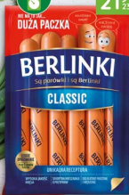
Parówki BERLINKI 700 g