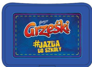
WIZUALIZACJA PUDEŁKA ŚNIADANIOWEGO